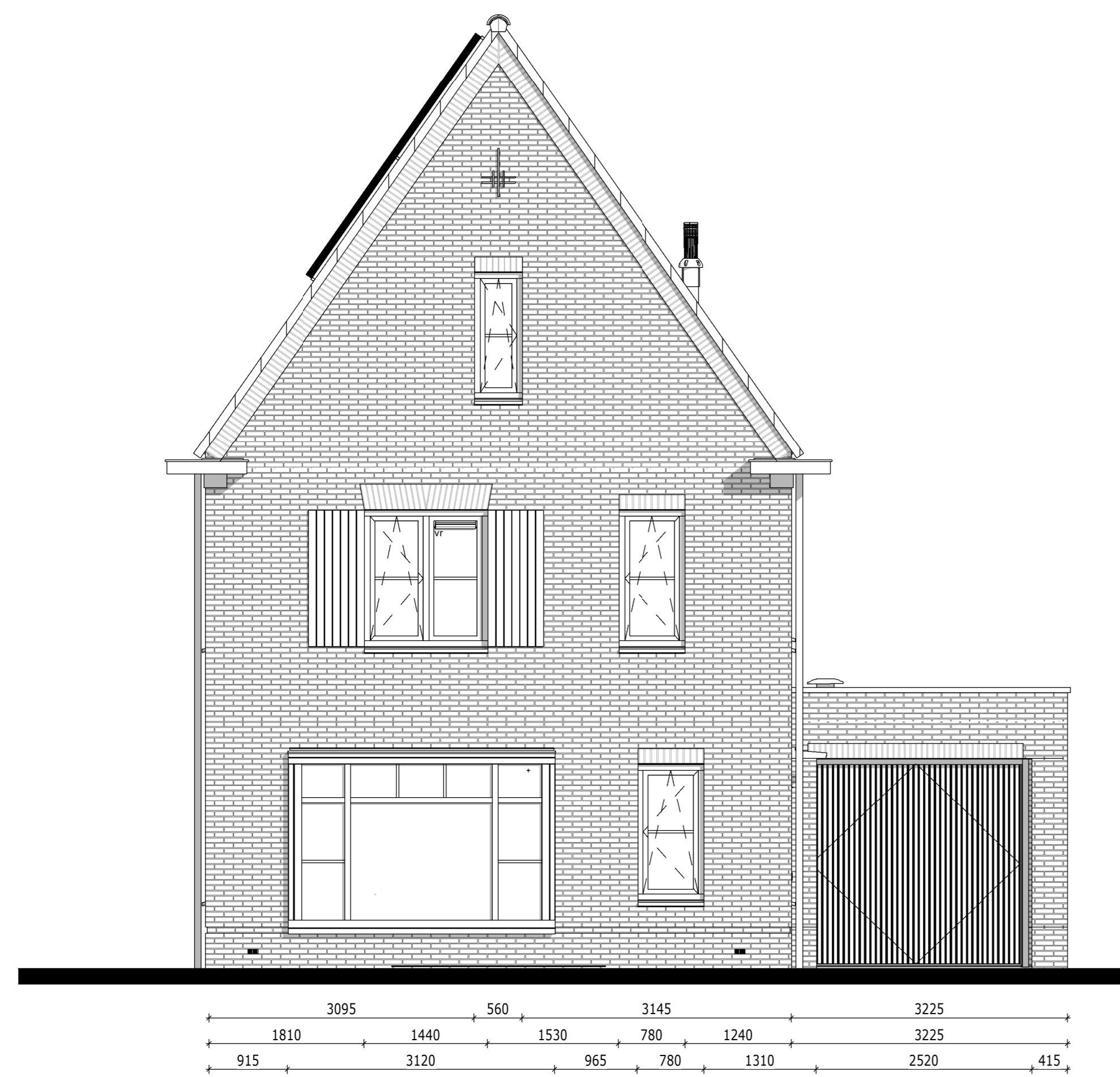
Voorgevel - Bouwnummer 056 1:50