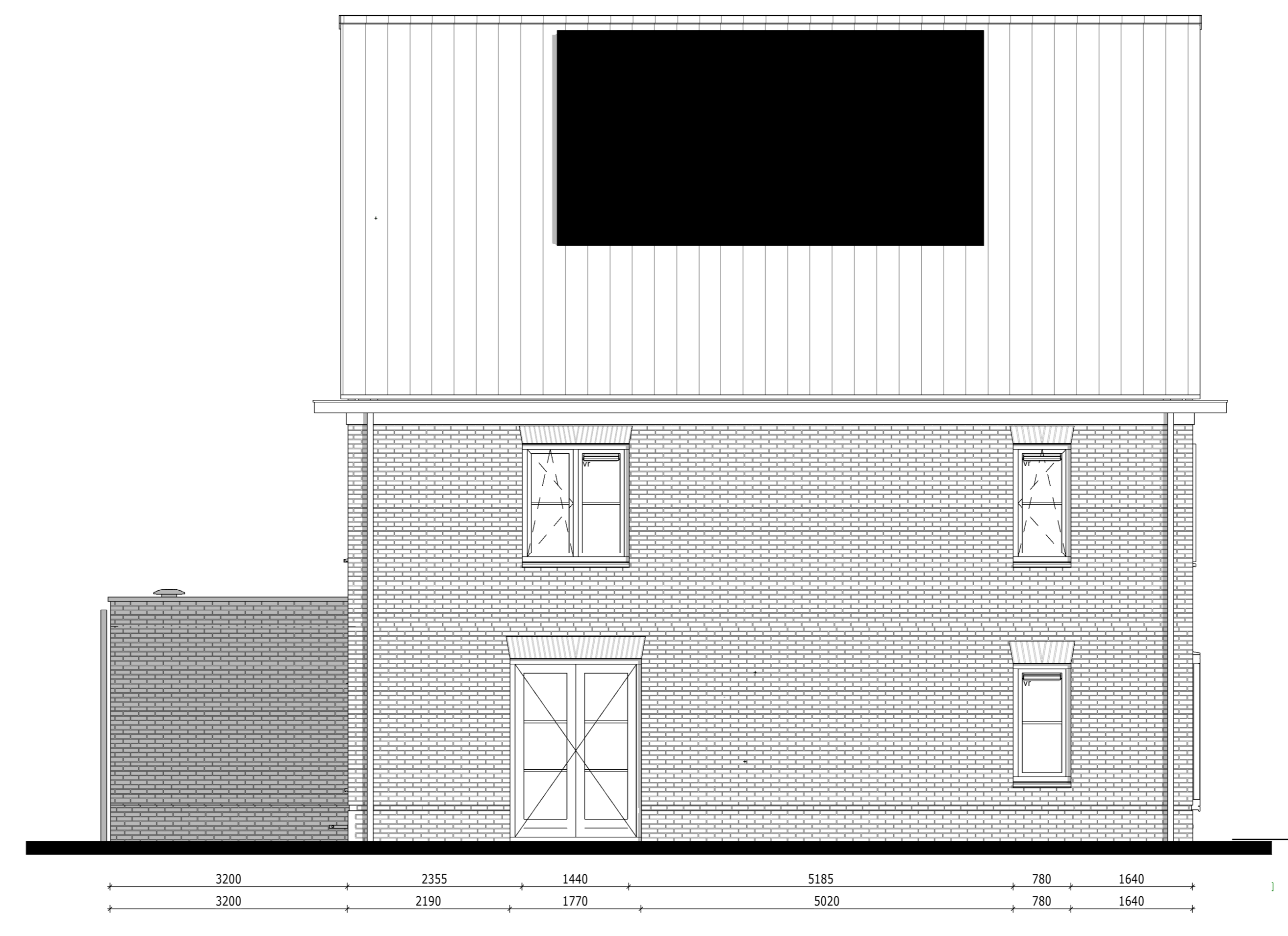
Linkergevel - Bouwnummer 056 1:50