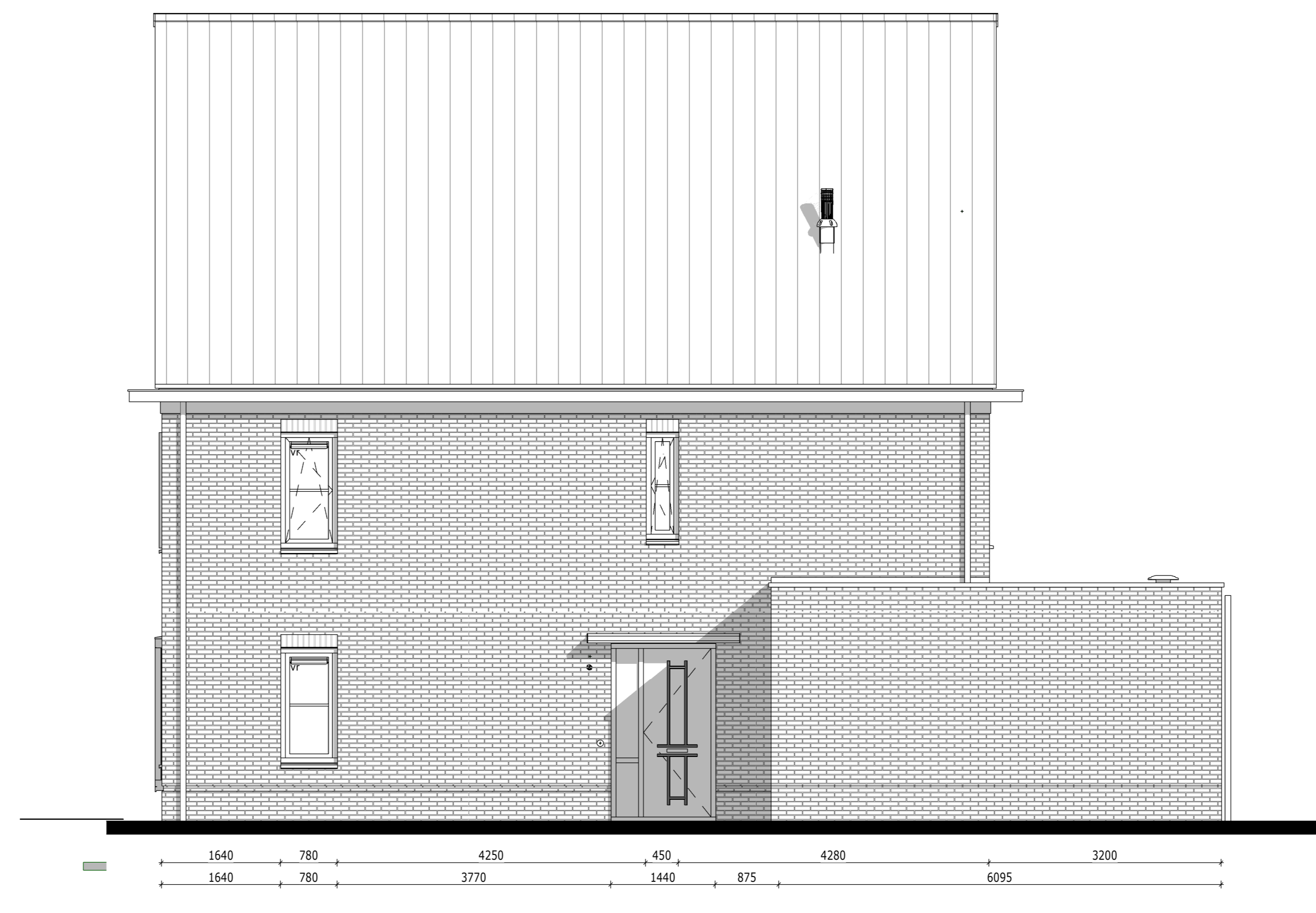
Rechtergevel - Bouwnummer 056 1:50