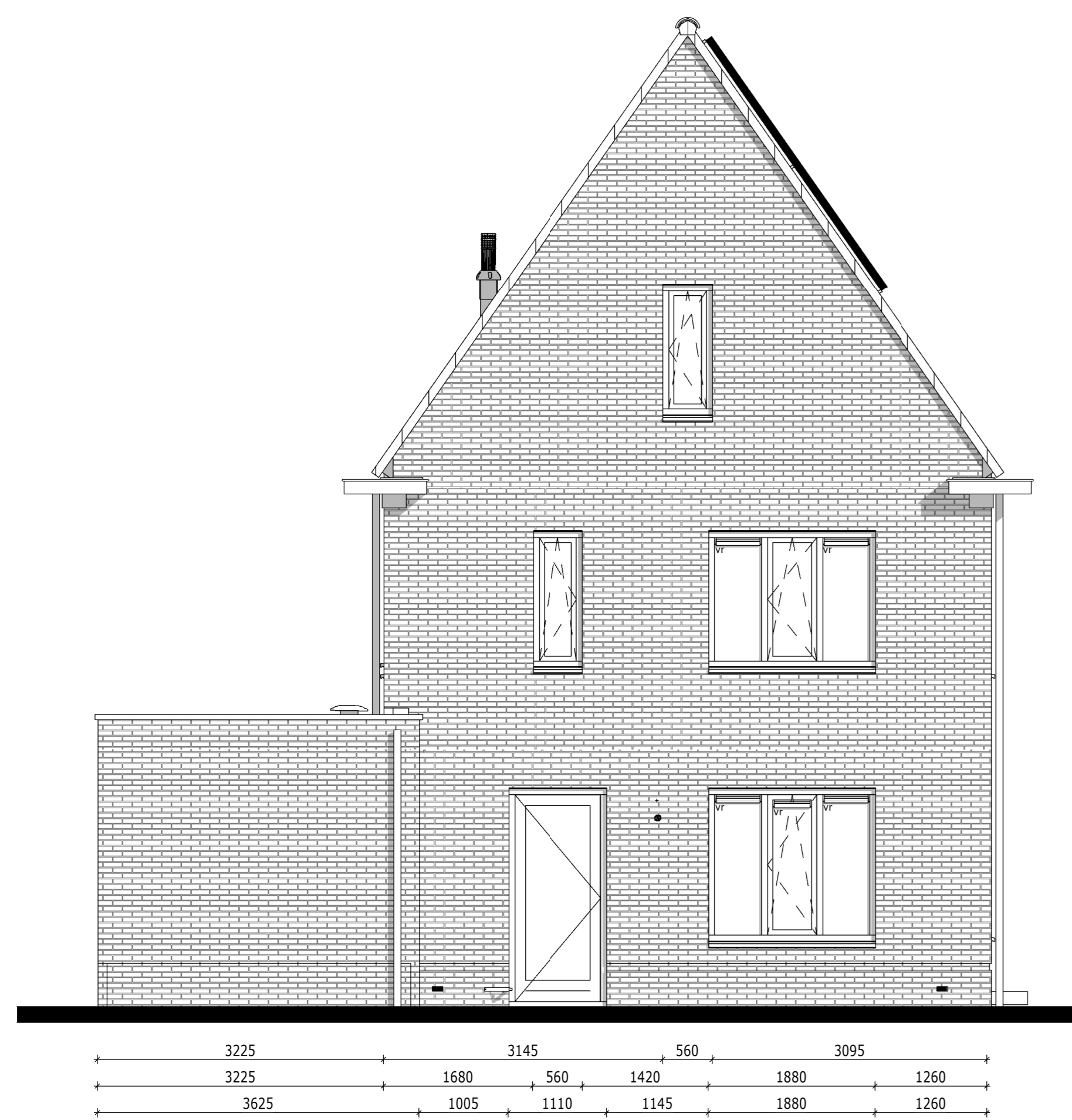
Achtergevel - Bouwnummer 056 1:50