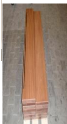
Voorbeelduitwerking van houten treden met één rubber anti-slip strip