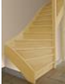
Voorbeelduitwerking van open trap (links) en dichte trap rechts)