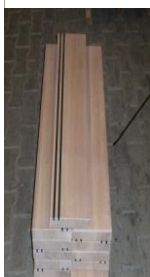
Voorbeelduitwerking van houten treden met twee rubber anti-slip strips