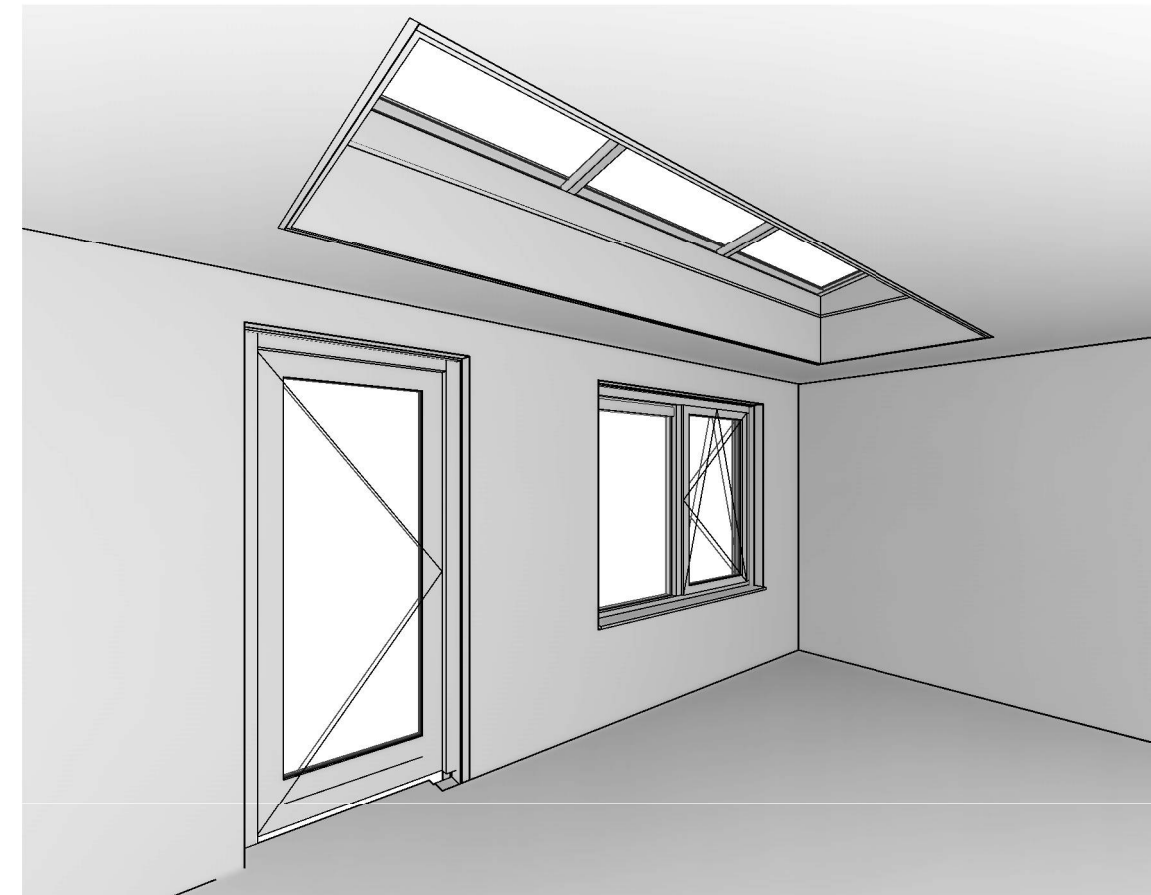
9500900_Lichtstraat impressie gezien van binnen