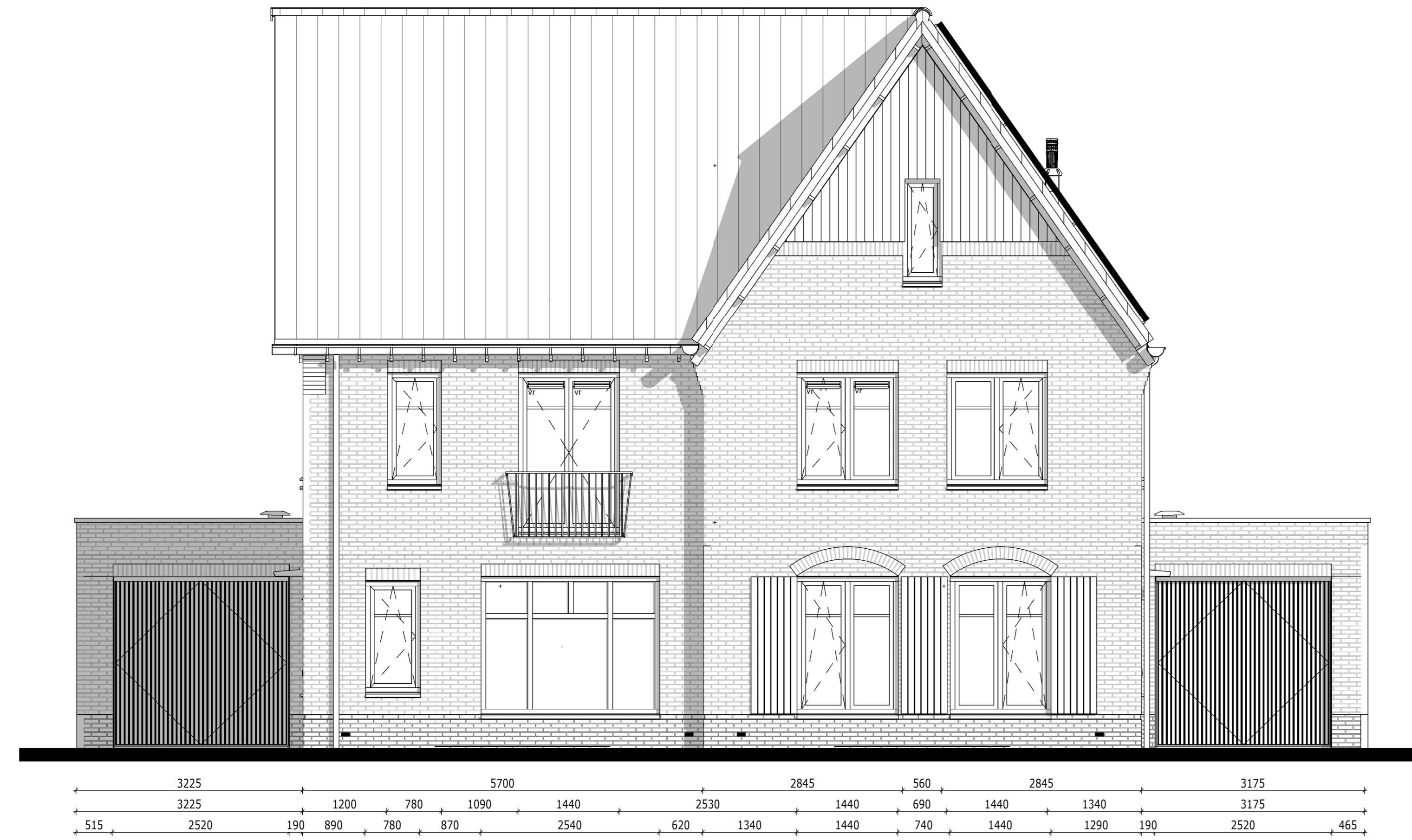
Voorgevel - Bouwnummer 054 & 055 1 : 50