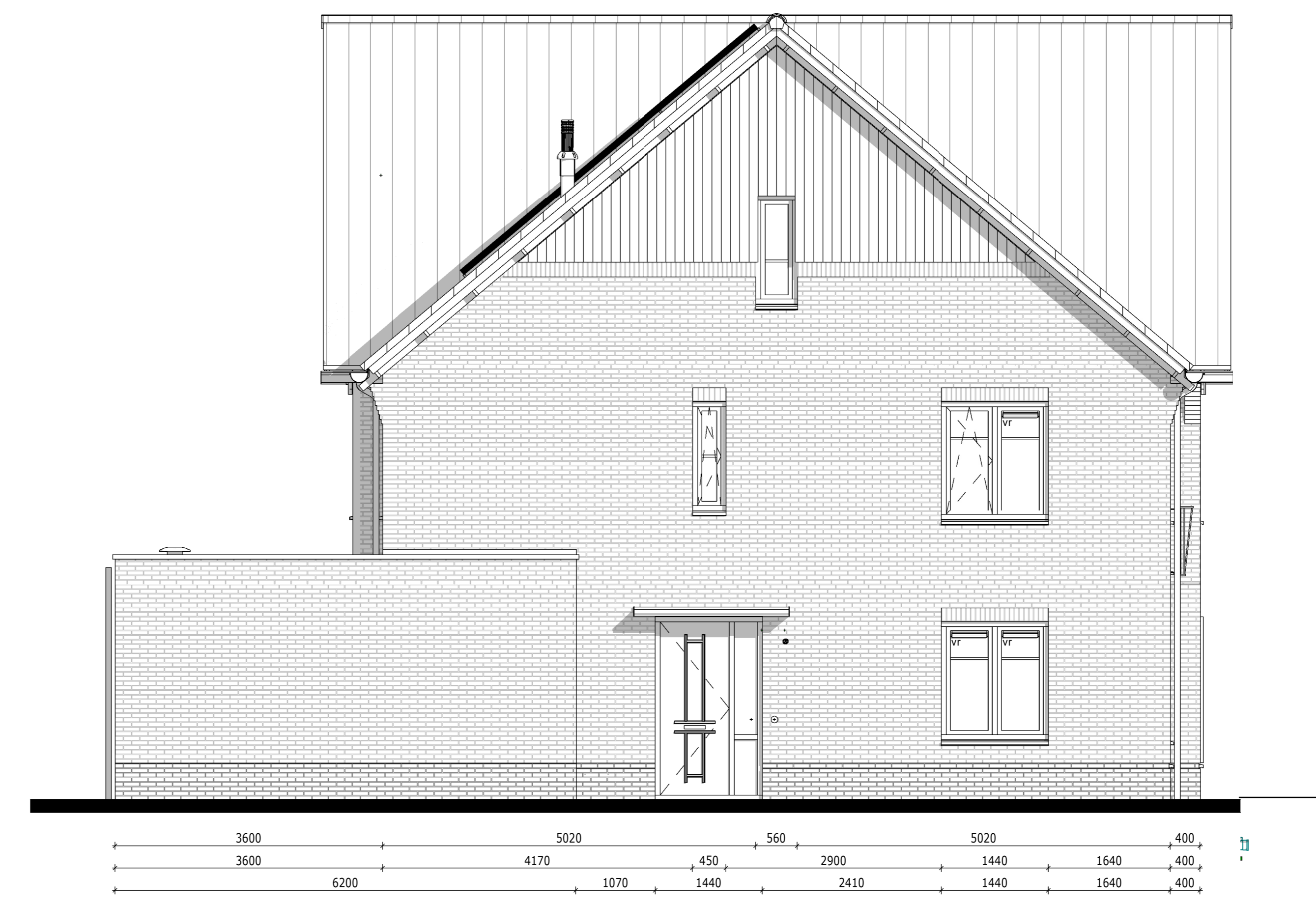
Linkergevel - Bouwnummer 054 & 055 1 : 50