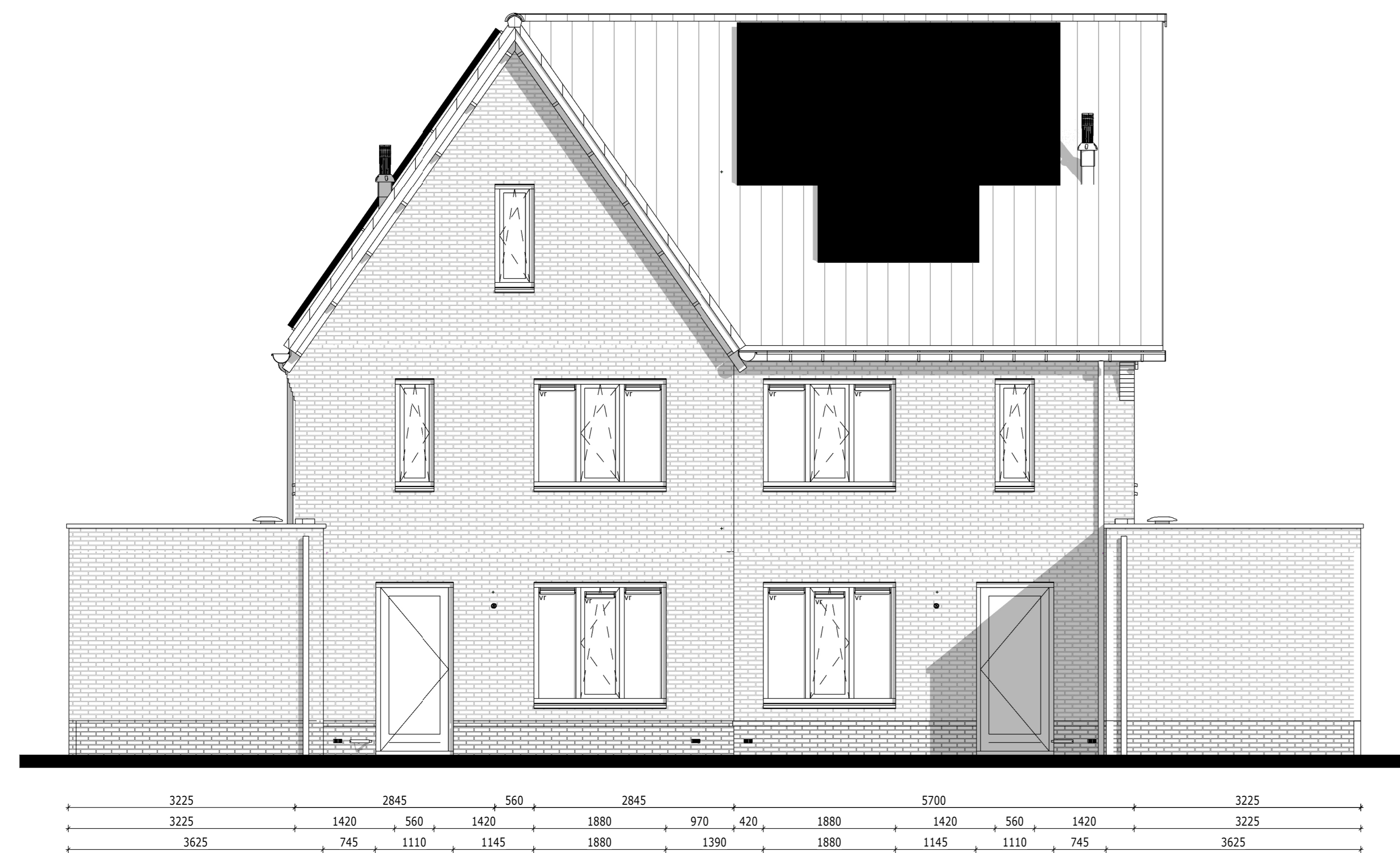
Achtergevel - Bouwnummer 054 & 055 1 : 50