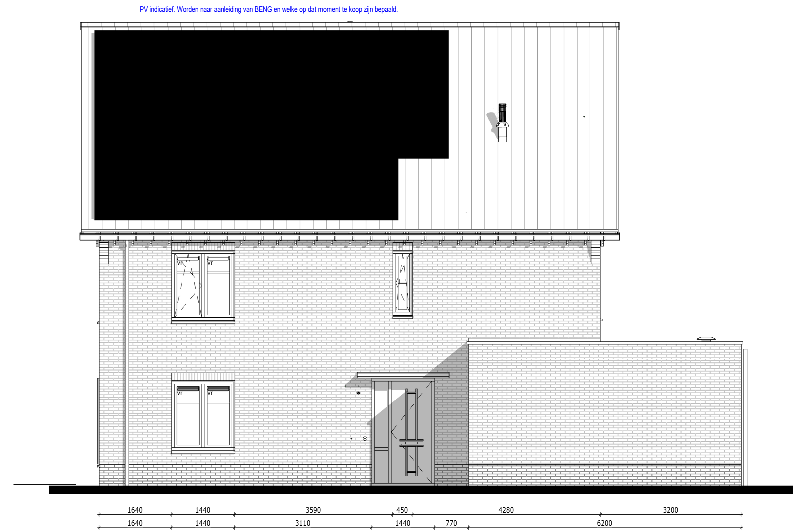
Rechtergevel - Bouwnummer 054 & 055 1 : 50