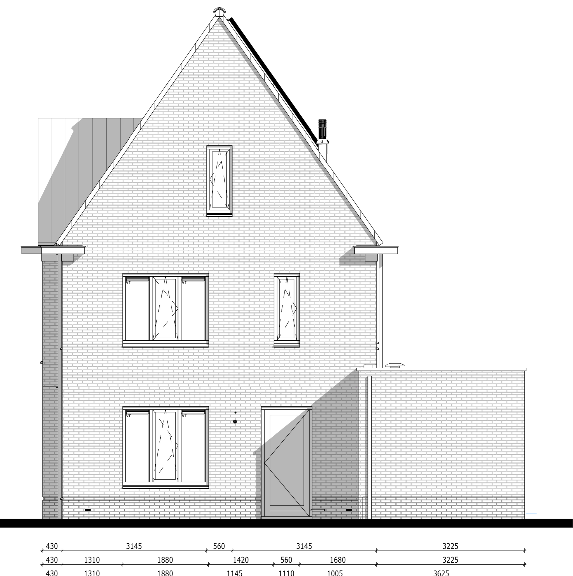
Achtergevel - Bouwnummer 059 1:50