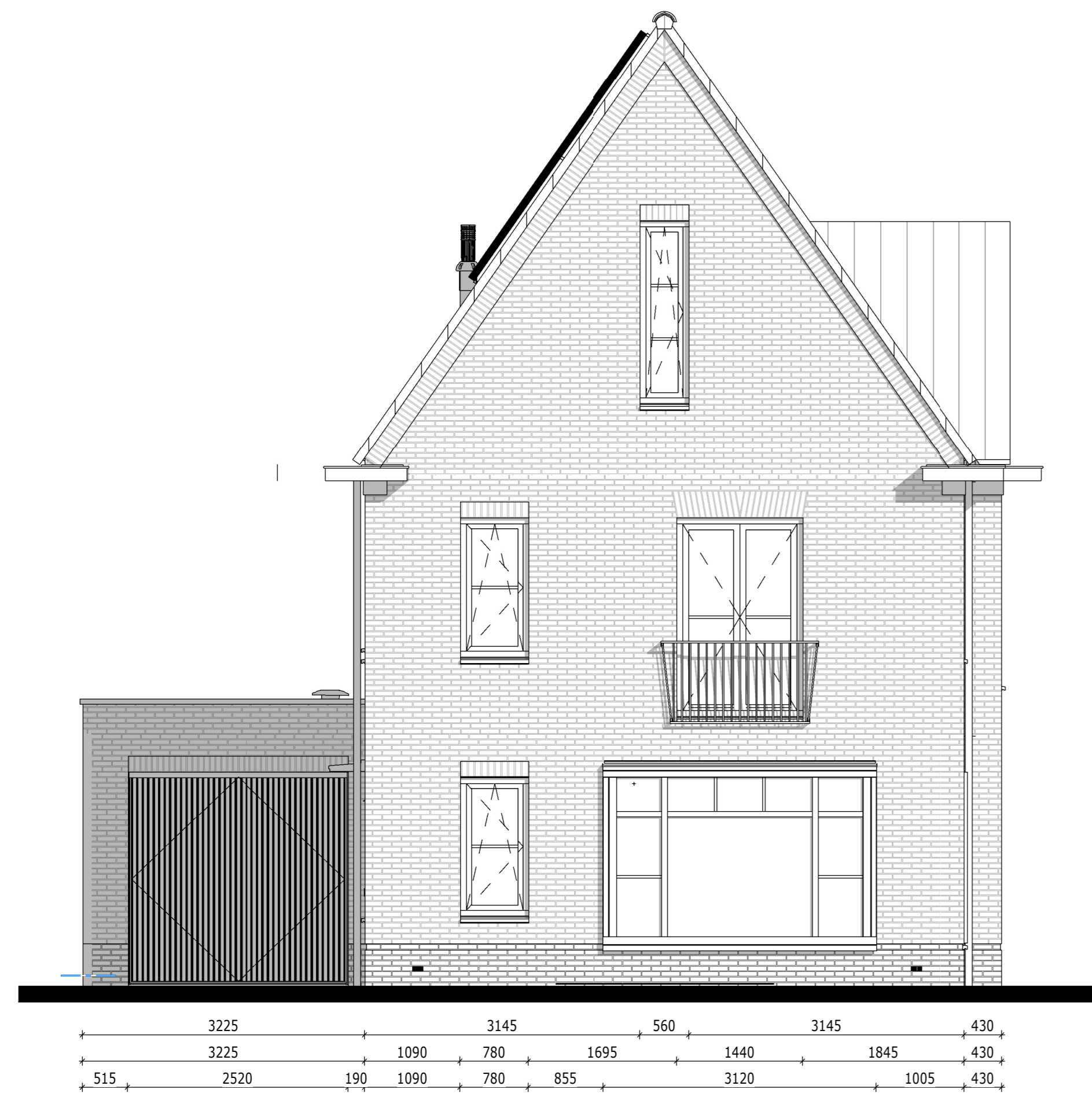
Voorgevel - Bouwnummer 059 1:50