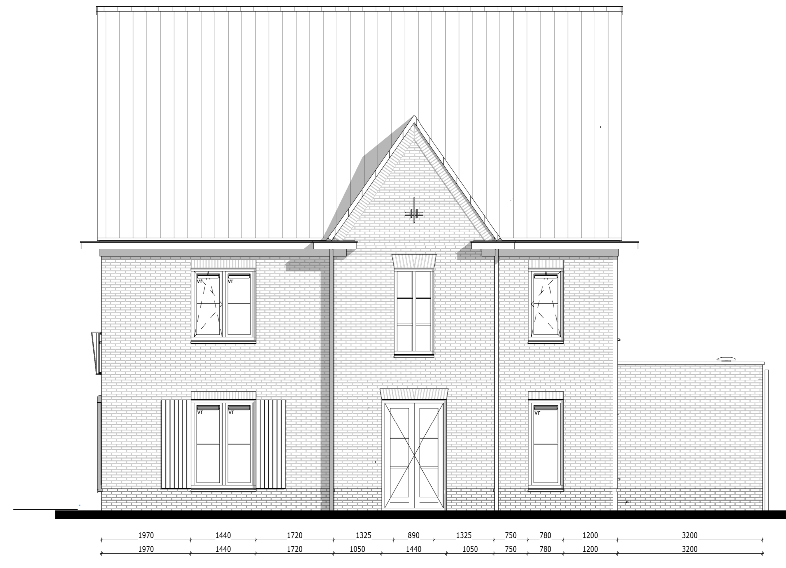
Rechtergevel - Bouwnummer 059 1:50