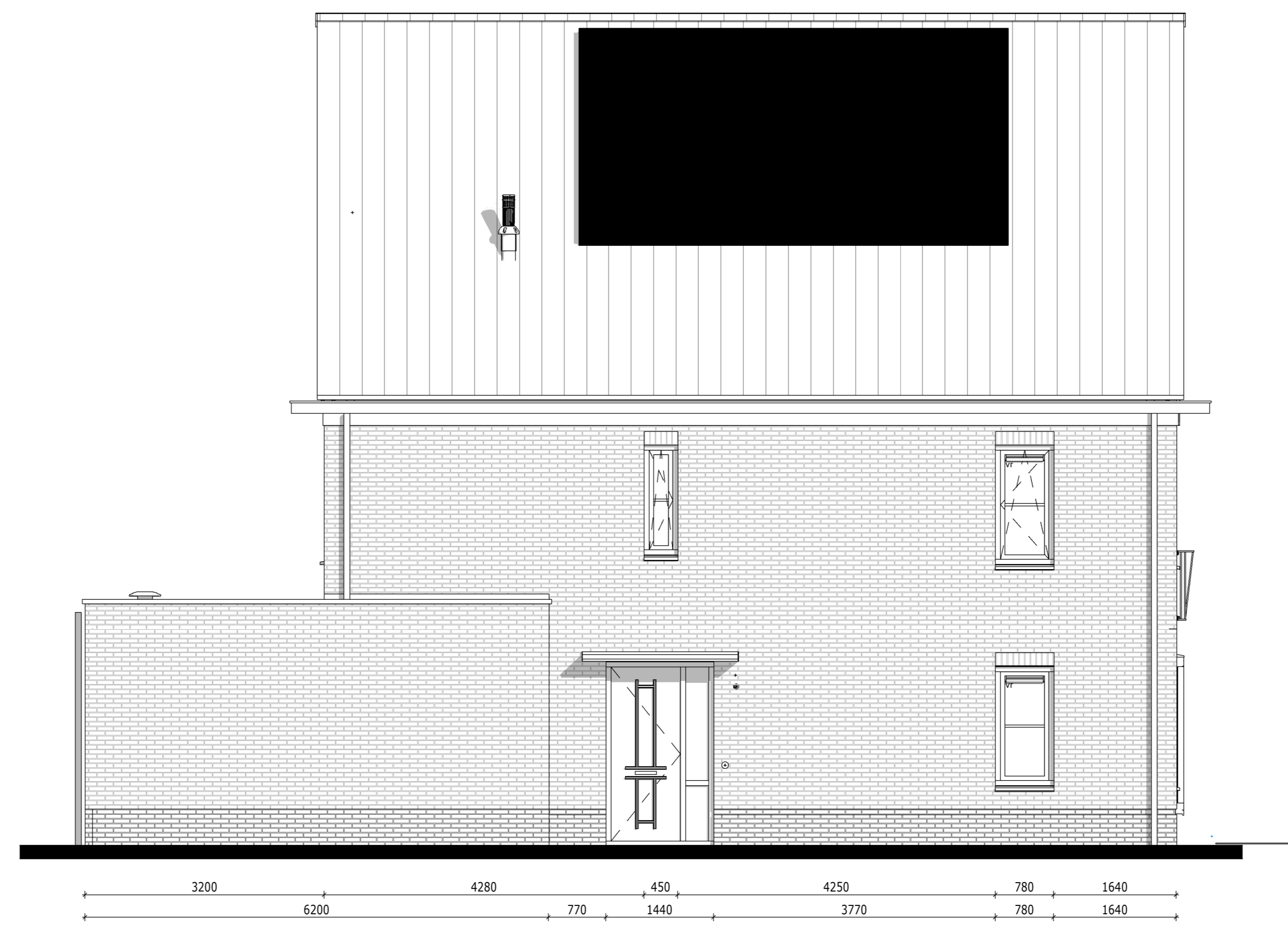
Linkergevel - Bouwnummer 059 1:50